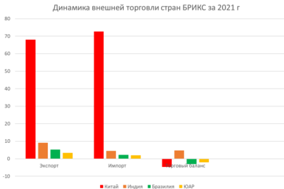
Рис. 3 – Динамика внешней торговли стран БРИКС за 2021 г. 8

Среди стран БРИКС основным торговым партнером России на период 2021 г. была КНР, имеющая самый высокий объем экспорта и импорта. С Индией у России был самый большой торговый баланс, составляющий примерно 4,7 миллиарда долларов США. Всего российский экспорт в страны БРИКС в 2021 году достиг почти 82,8 млрд долларов США. (рис.3)