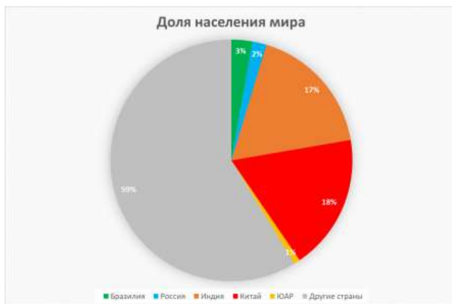
Рис.1 – Доля населения мира, % 5

А также по показателям ВВП страны БРИКС отличаются высокими темпами роста, что говорит об их эффективном взаимодействии в экономическом пространстве.