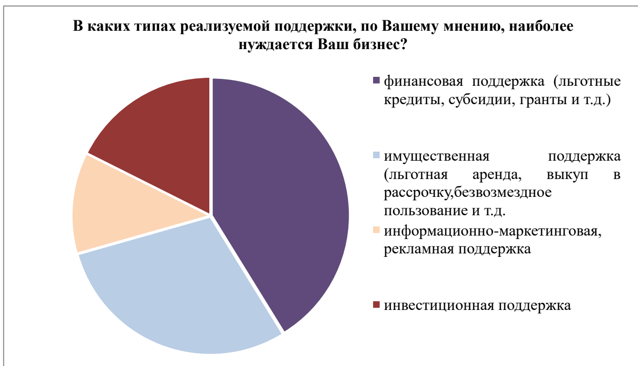
Рис. 2 – Меры поддержки, наиболее необходимые МСП Обнинска

Из результатов опроса можно сделать вывод о том, что наиболее эффективными типами поддержки обнинские предприниматели считают финансовую (41,2%), имущественную (29,4%) и инвестиционную (17,6%). В меньшей степени предпринимателям необходимо маркетинговая или рекламная поддержка, а вот в правовой поддержке они не заинтересованы вовсе (рис. 2).