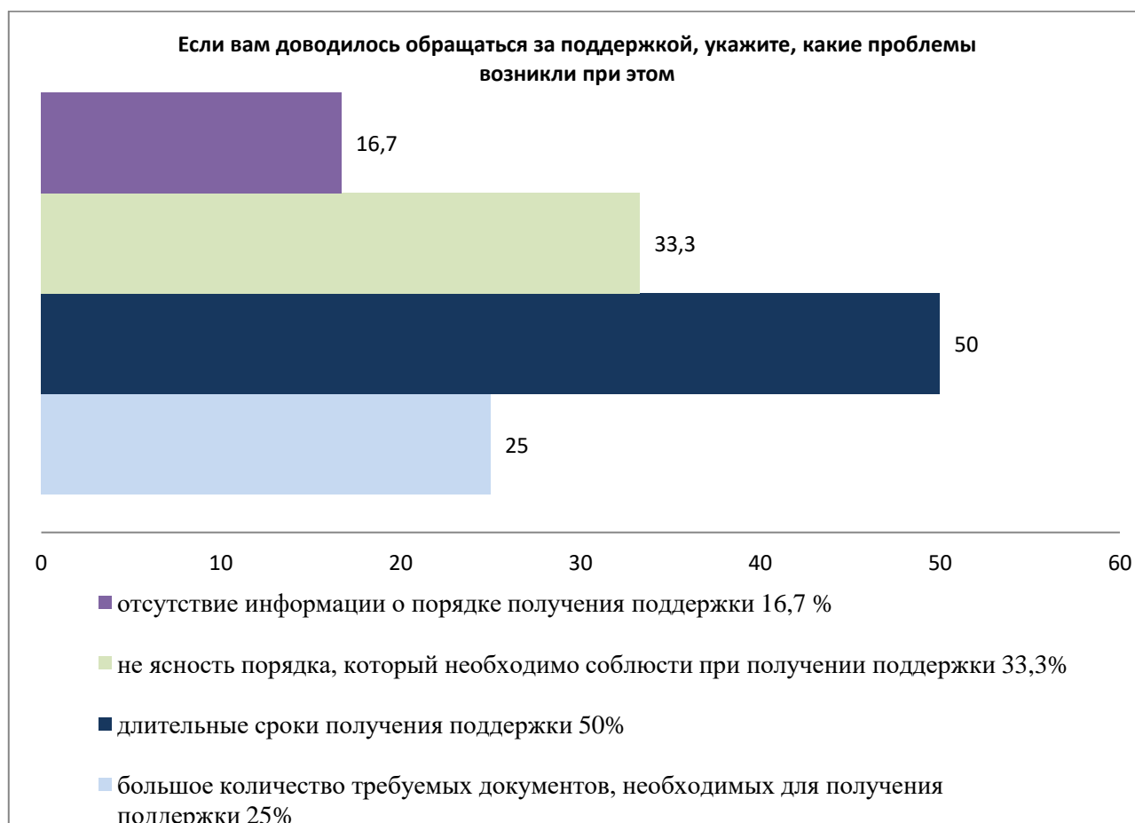
Рис. 3 – Проблемы получения поддержки МСП Обнинска

Рисунок 3 демонстрирует основные проблемы получения поддержки для МСП: длительные сроки получения поддержки, отсутствие определенной ясности процедур получения поддержки, слишком большое количество необходимых для получения поддержки документов, а также и полное отсутствие информации о порядке получения поддержки.