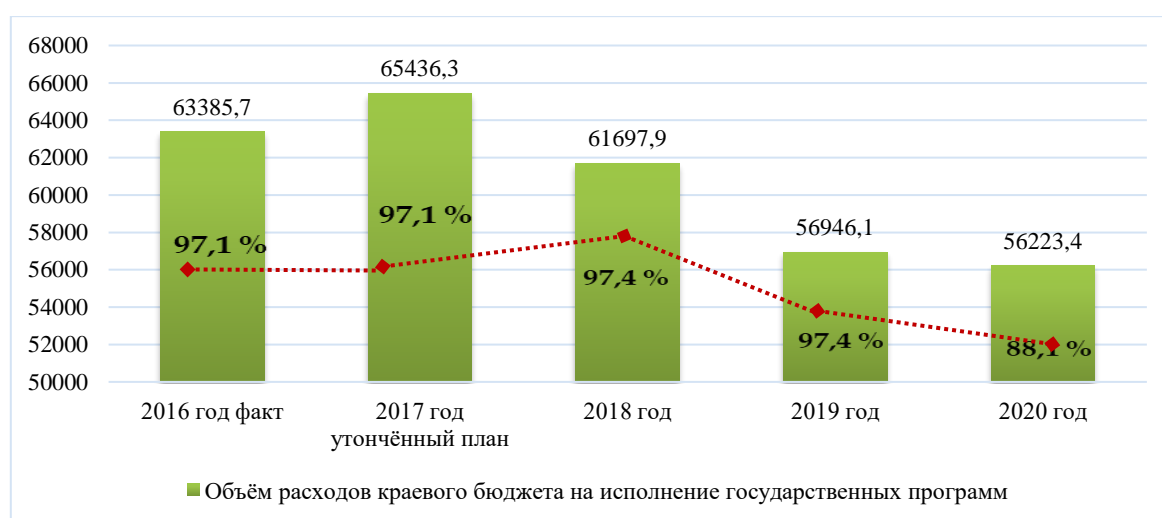
Рис. 4 – Динамика программных расходов бюджета Камчатского края 7

Особенностью программно-целевого метода является заявительный характер. Структура расходов на реализацию государственных программ формируется «Снизу-вверх». Органы местного самоуправления изучают потребности населения в рамках своих полномочий, формируя муниципальные