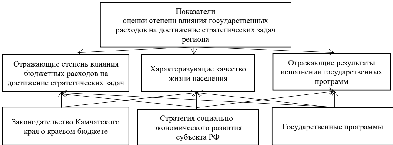
Рис. 2 – Структура показателей оценки степени влияния государственных расходов на достижение стратегических задач региона 5

Показатели, характеризующие качество жизни населения включают: