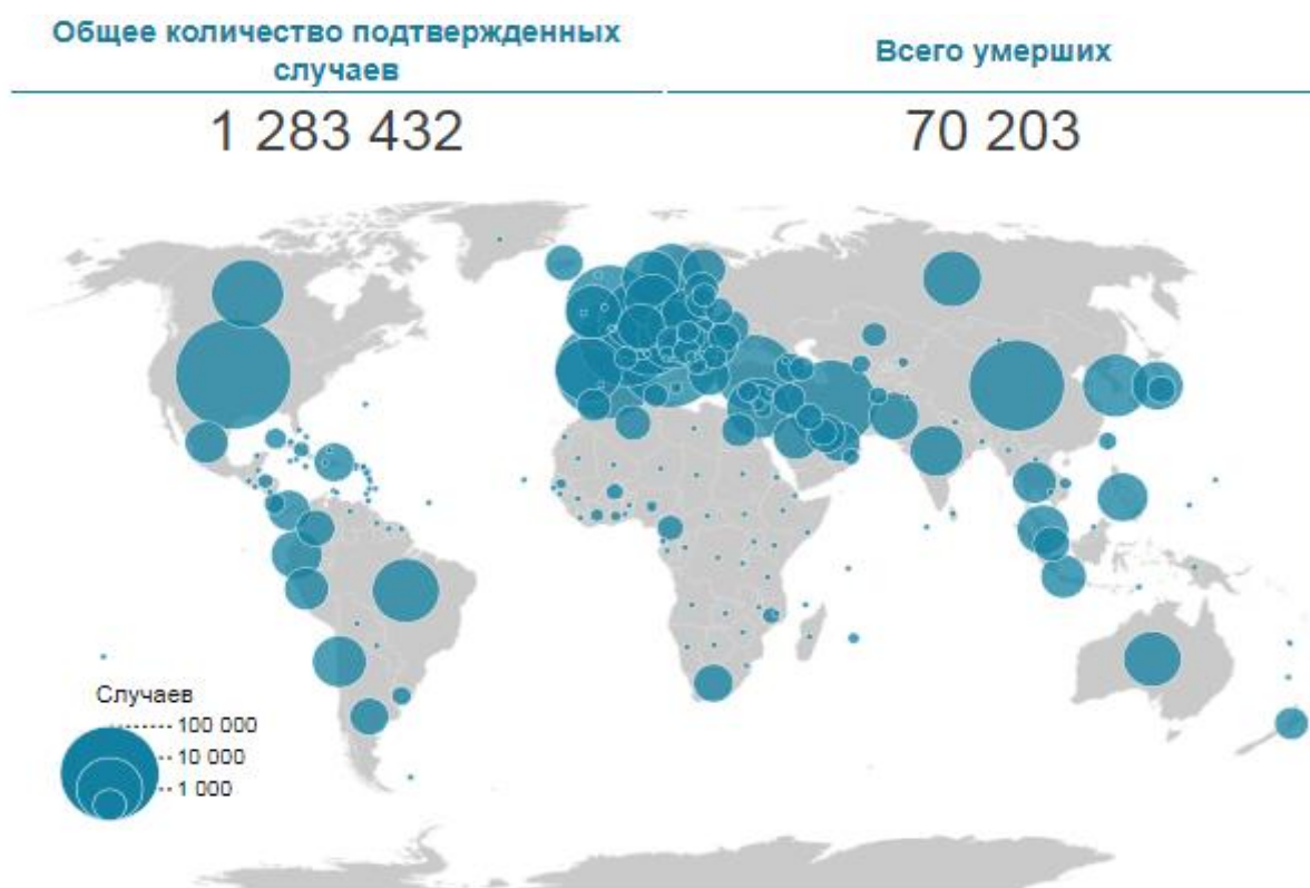
Рис. 1 – Статистические данные по зараженным коронавирусом в Мире [7]

Из-за распространения коронавируса 2019-nCoV, которое Всемирная организация здравоохранения признала пандемией, все туристические направления оказались под запретом. Кроме того, российские и международные авиакомпании отменяют все больше рейсов внешнего и внутреннего авиасообщения. Затрудняет перемещения и введение отдельными странами домашнего карантина для приезжающих.