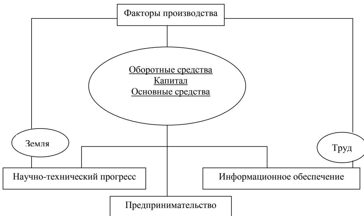
Рис. 1 – Схема факторов производства

На современном этапе развития экономики как науки к уже перечисленным четырем факторам производства следует отнести еще два: научно-технический прогресс и информационное обеспечение (рис.1).