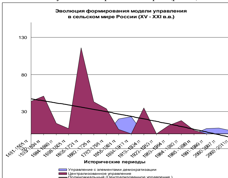
Рис. 1. Формирование модели управления сельским миром в России 1

опыта, обходится слишком дорого для последующих поколений [11]. Тем более, как показало исследование, государственное регулирование аграрной отрасли в России имеет глубокие исторические корни (рис. 1).