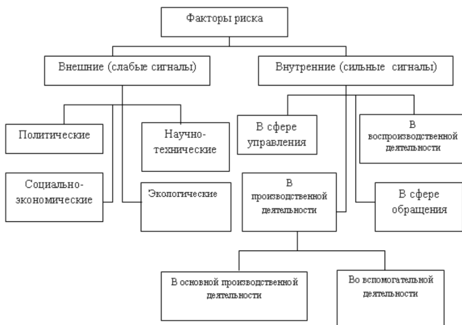
Рис. 1 –Классификация факторов рисков предприятия

В зависимости от характера риска и стратегии его управления, могут быть приняты различные меры по снижению или устранению рисков. Это может быть страхование, принятие мер по безопасности и экологии, обучение персонала и следование нормам качества, внедрение новых технологий и т.д. В зависимости от места возникновения факторы рисков делятся на внешние и внутренние (рис.1)