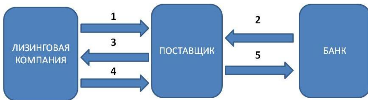
Рисунок 3. Схема финансирования поставщика

1. Дочерняя лизинговая компания перечисляет аванс поставщику в размере аванса лизингополучателя.