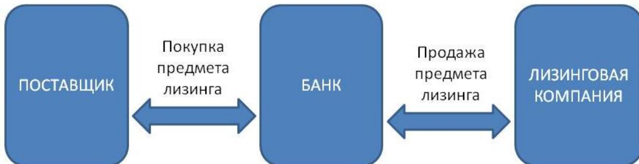
Рисунок 2. Схема взаимодействия банка и лизинговой компании с использованием коммерческого кредита

Банк покупает предмет лизинга у поставщиков и осуществляет его оплату в полном объеме. Затем продает его лизинговой компании с отсрочкой и рассрочкой платежей. Право собственности переходит к лизинговой компании с момента подписания накладной. Лизинговая компания передает предмет в лизинг.