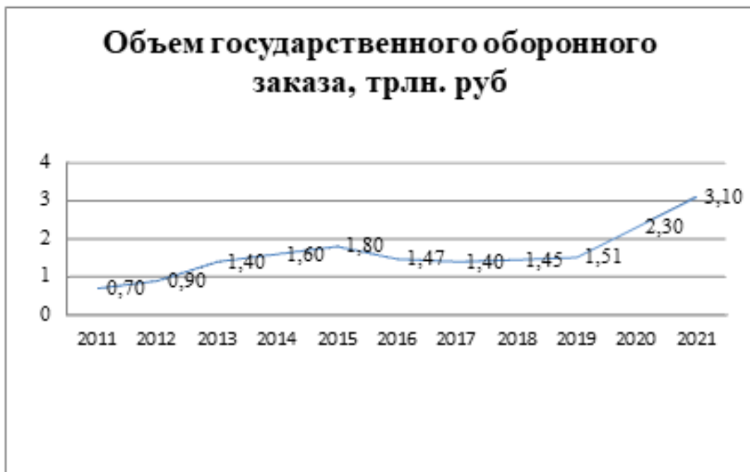
Рис. 3 – Объем государственного оборонного заказа Министерства обороны в период 2011-2021 года [4]

Как видно из рис. 3, ежегодный объем государственного оборонного заказа с каждым годом растет, а на конец 2021 года превышает сумму 3,1 трлн. рублей.