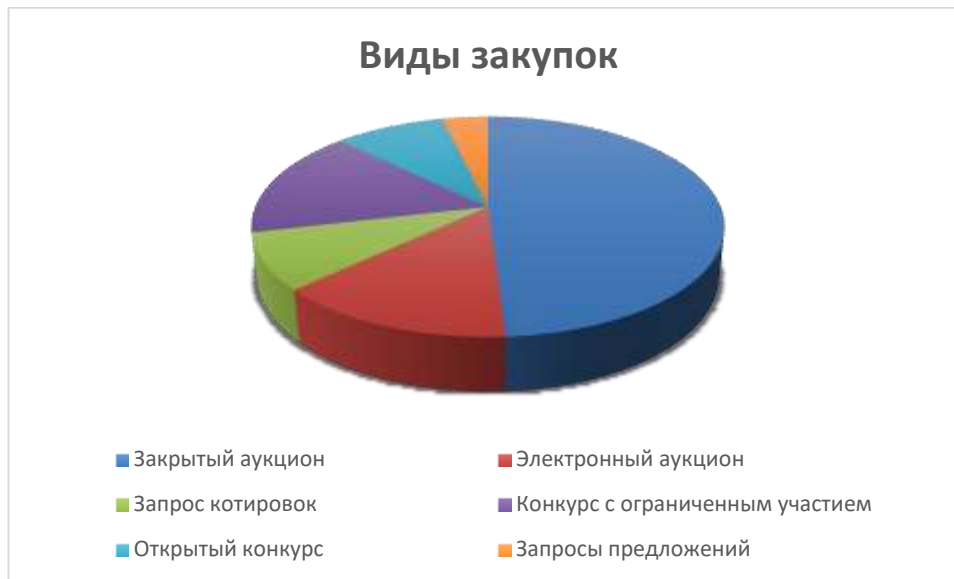
Рис. 1 – Распределение по видам государственных закупок для удовлетворения государственных и муниципальных нужд

кварталу 2020 года (2,29 тыс. проверок)).