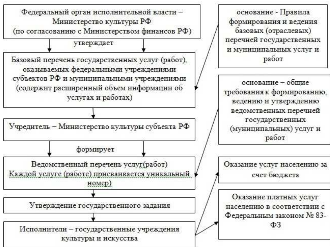
Рис. 3 – Организация оказания услуг продуцентами сферы культуры 9

Данные проблемы, существующие, прежде всего, при взаимодействии сектора государственного управления и продуцентов услуг в процессе формирования государственных (муниципальных) заданий в сфере услуг культуры, создал устойчивые предпосылки для формирования и практической реализации нового подхода к организации и предоставлению услуг в общественном секторе, что полностью соответствует опыту лучших практик.