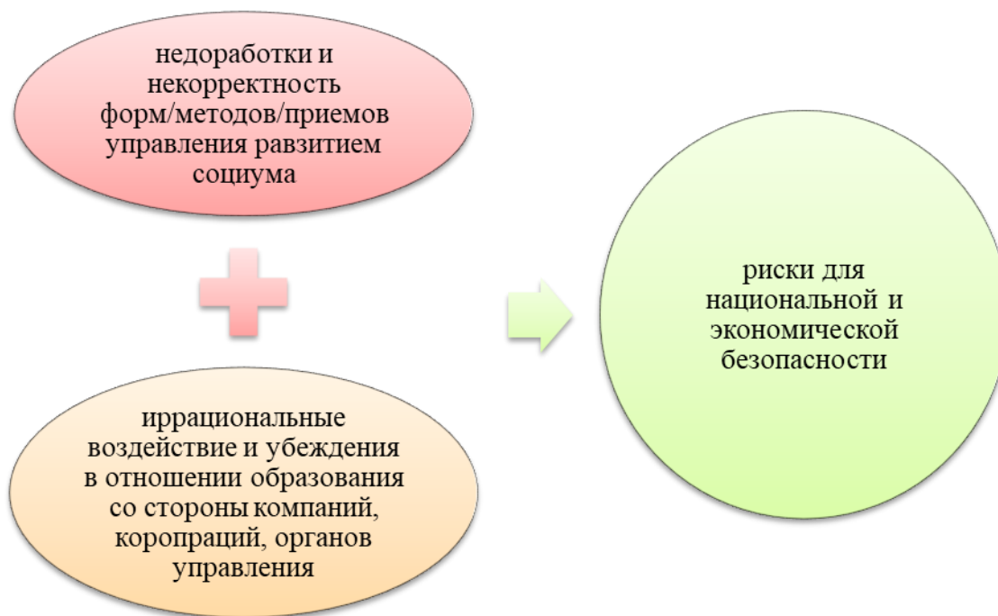
Рис. 3 – Риски для национальной и экономической безопасности, вызванные системой образования

экономической и национальной безопасности. Сейчас в высших учебных заведениях для подготовки таких кадров излишний интерес сосредоточен на развитии корпораций, что обуславливает акцент и изучение специфики управленческих аздов на уровне производства и коллектива [2].