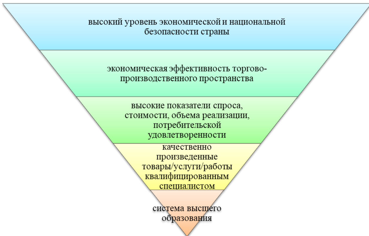
Рис. 2 – Качество продукции в системе экономической безопасности

так и посредством оказания воспитательного влияния, содействующего на совершенствование степени ответственности кадров за итоги деятельности, и закладывание основ в виде знаний и навыков в образовательном процессе [1].