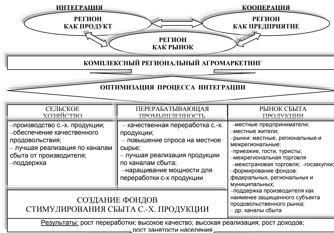
Рис. 2. Схема модели оптимизации процесса интеграции и кооперации в региональном агромаркетинге [4]

Наличие этих связей служит основой формирования производственно-хозяйственных комплексов и различного рода объединений. Они в значительной степени предопределяют характер их организационно-управленческого построения и выбор методов для регулирования межотраслевой деятельности.