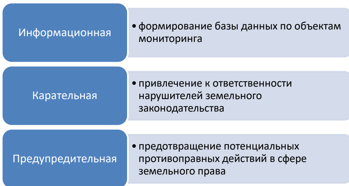
Рис. 1 – Функции земельного контроля