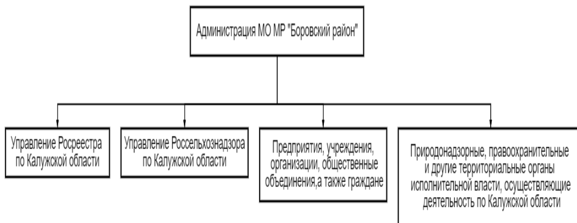
Рисунок 3 – Субъекты взаимодействия при реализации функций МЗК

Мероприятия МЗК могут осуществляться как самостоятельно, так и с привлечением специалистов государственного земельного надзора, природонадзорными и правоохранительными учреждениями [4], а также органами местного самоуправления городских поселений и соседних муниципальных районов.