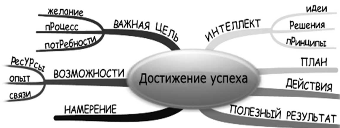
Рис. 2 – Слагаемые успеха

На рисунке 2 представлена схема достижения успеха.