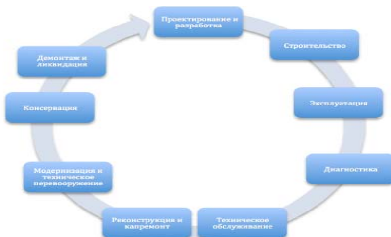
Рис. 1 – Жизненный цикл основных фондов

Основные фонды предприятия имеют жизненный цикл, который можно представить в виде следующей схемы (рисунок 1).