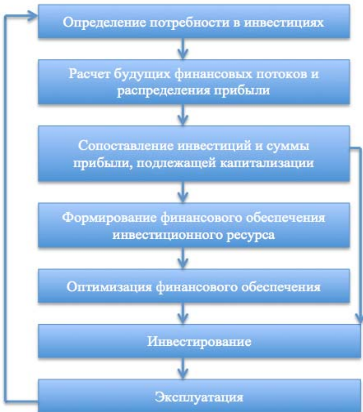
Рис. 3 – Алгоритм реализации воспроизводственного процесса инвестиционной деятельности в молочнопродуктовом подкомплексе АПК РФ

Вместе с тем, инвестиционная деятельность требует ее ресурсного обеспечения, что в условиях дефицита ресурсов актуализирует необходимость воспроизводства инвестиционной деятельности (рисунок 3).