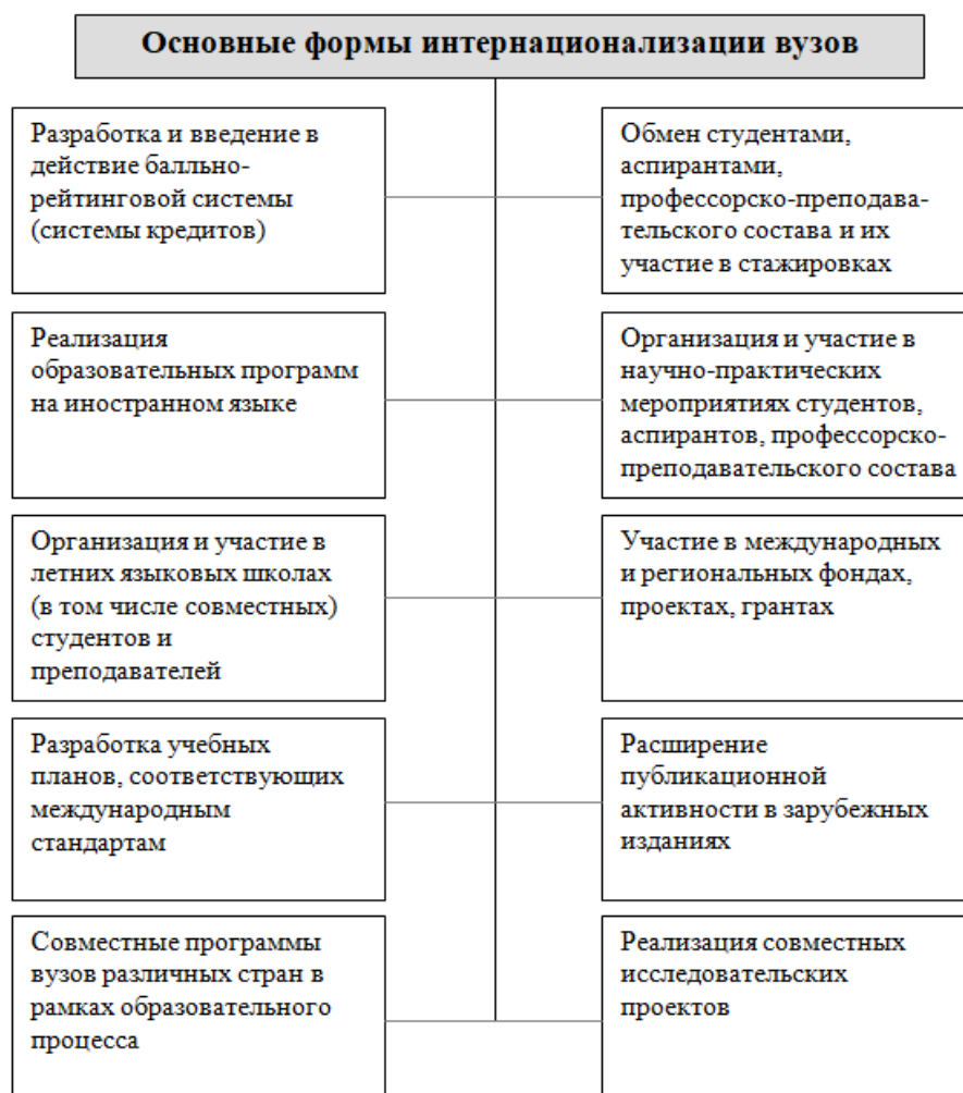
Рис. 2 – Основные формы интернационализации вузов 2

Основные формы интернационализации вузов, посредством которых она осуществляется, представлены на рис. 2.