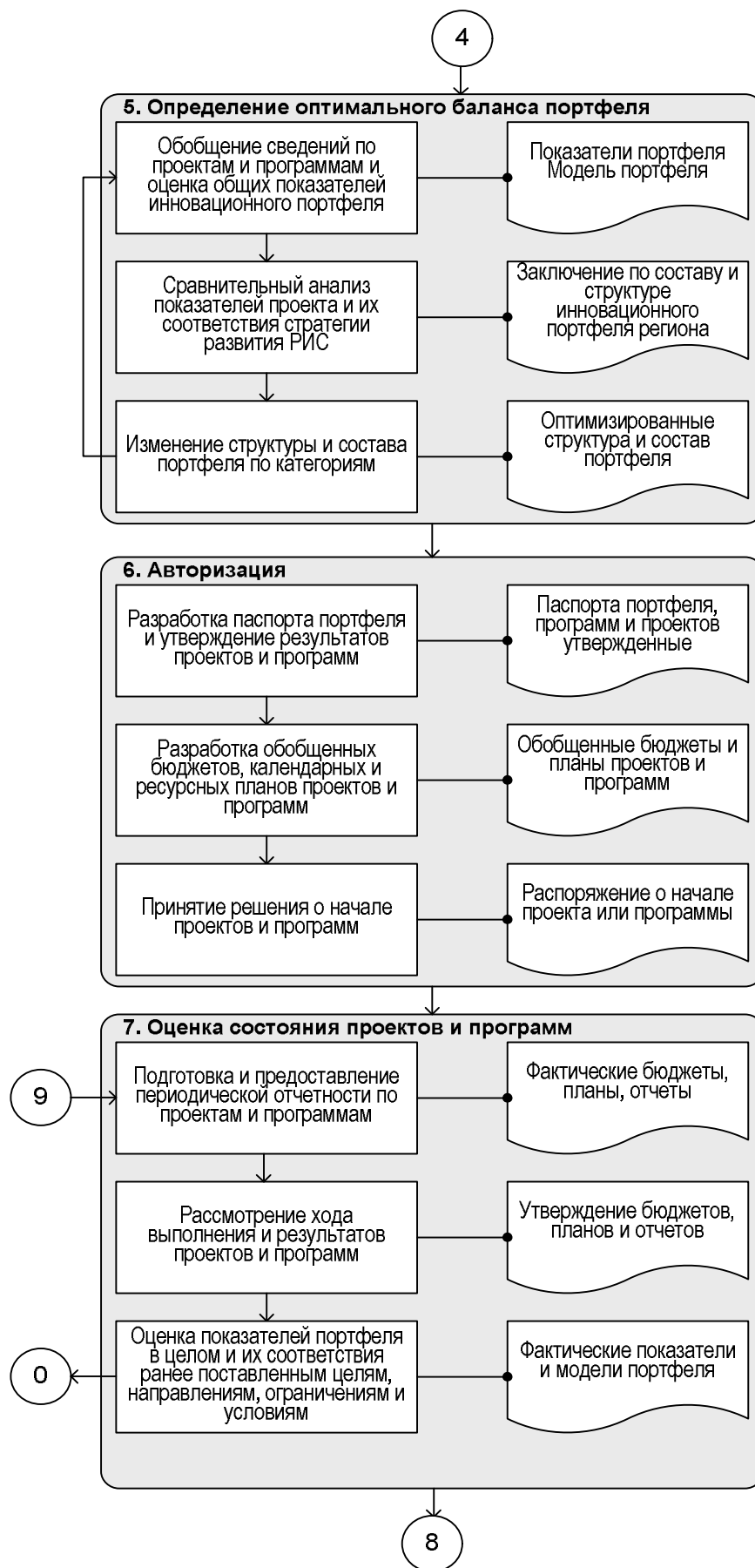
Модель процессов управления инновационным портфелем региона (продолжение)