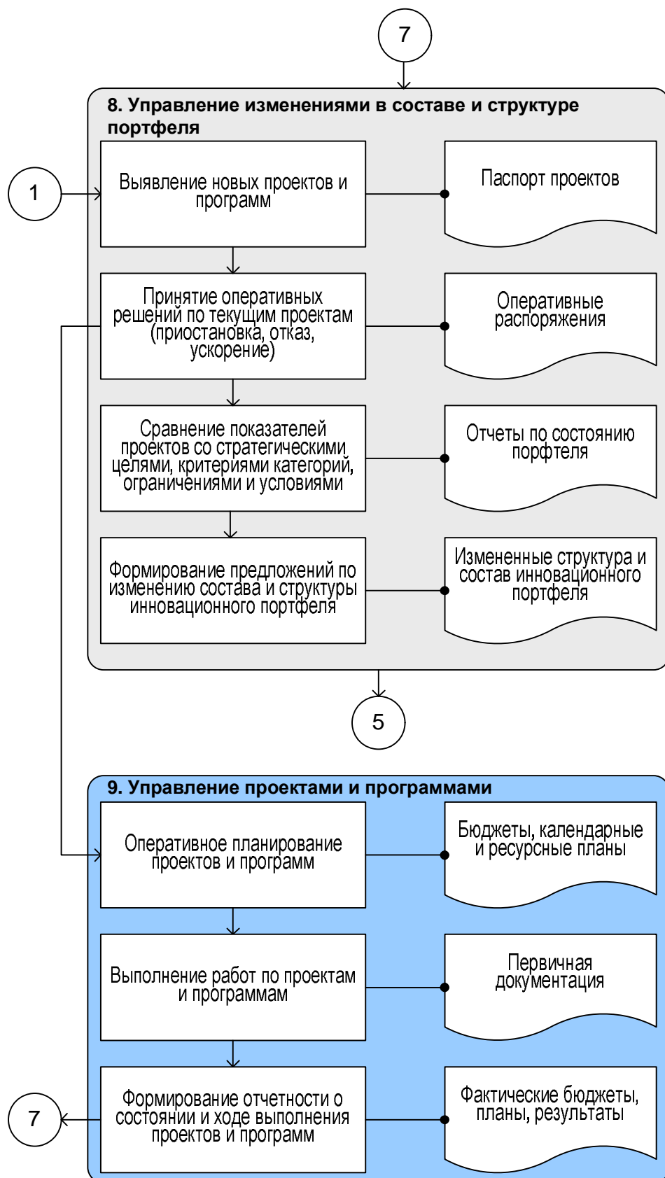
Модель процессов управления инновационным портфелем региона (окончание)