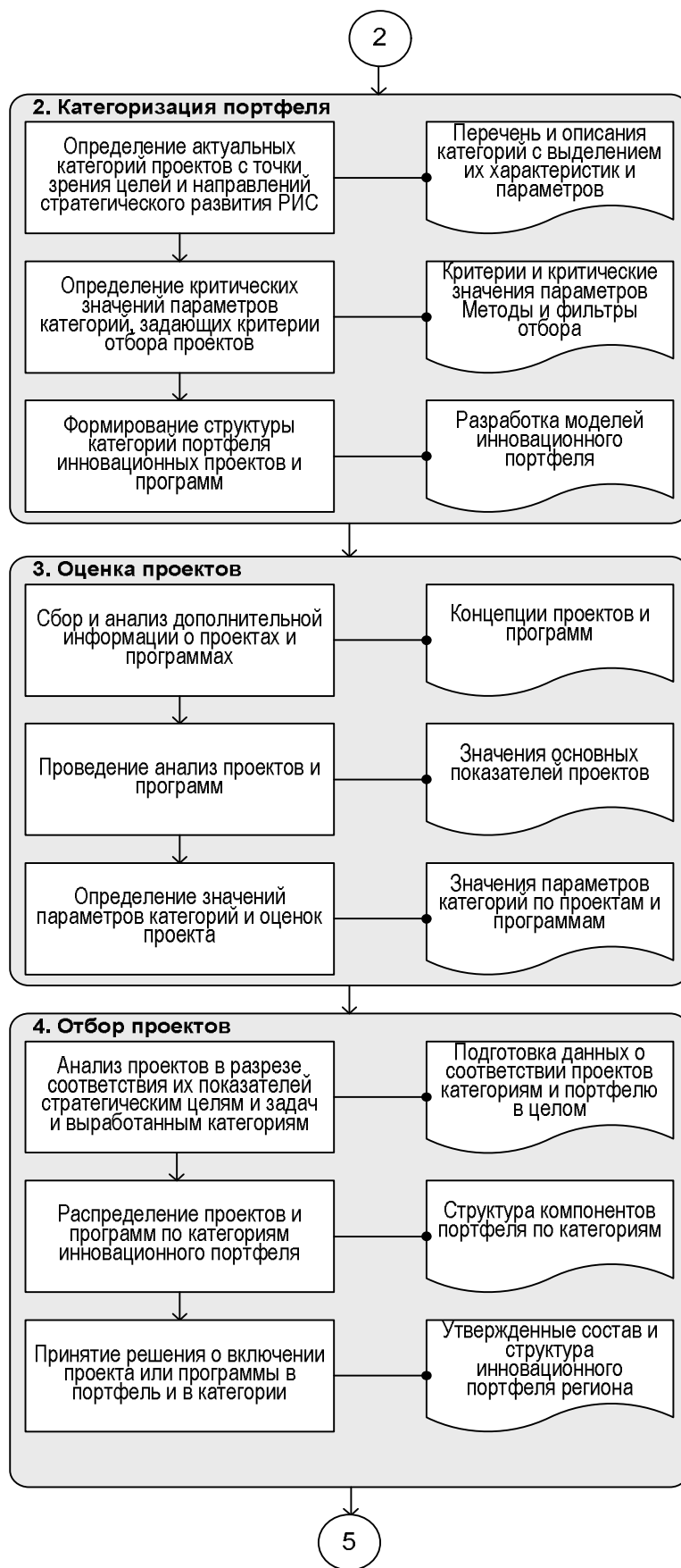
Модель процессов управления инновационным портфелем региона (продолжение)