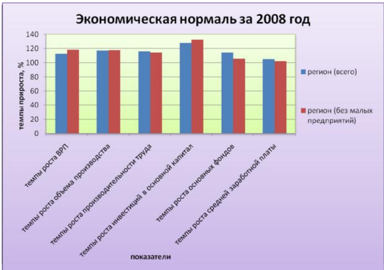
Рис. 1. Экономическая нормаль за 2008 г.