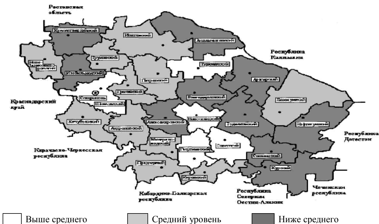
Рисунок 2 – Распределение районов Ставропольского края по интегральной рейтинговой оценке социально-экономической эффективности аграрного предпринимательства

Результаты интегральной рейтинговой оценки социально-экономической эффективности аграрного предпринимательства Ставропольского края наглядно представлены на рисунке 2.