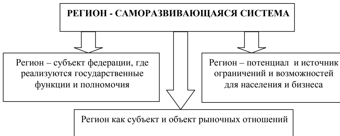
Рис. 2. - Регион как сложная подсистема системы национальной экономики

Регион имеет свои приоритетные направления воздействия, определяемые спецификой его социально-экономического пространства. В то же время регион является структурным элементом в системе национальной и глобальной экономики. Поэтому, являясь объектом воздействия на региональные преобразования, регион может выступать в качестве субъекта макроэкономических реформ. Его субъективная роль здесь реализуется через систему межрегиональных взаимосвязей и взаимодействия с федеральным центром, другими регионами России и других государств. Эту объективно-субъективную сущность региона также необходимо учитывать при формировании стратегии регионального развития.